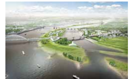
Dijkverlegging bij Lent-Nijmegen

Overstromingen zijn zo'n risico. De waterstanden op zee en in onze rivieren en beken kunnen snel stijgen; sowieso ligt een groot deel van ons land onder de waterspiegel. Met dijken, duinen en gemalen voorkomen we dat het land onderloopt en er slachtoffers vallen. De veiligheid van dit beschermingssysteem is in Nederland zo groot dat de vraag óf we binnen die beschermde polders verder willen verstedelijken niet meer aan de orde is. De vraag is eerder hóé we onze steden zo veilig mogelijk inrichten. Dat begint met voldoende ruimte maken – en behouden – voor alle beschermende voorzieningen die nodig zijn: ruimte voor dijken en gemalen, en ruimte voor rivieren en beken, zodat die hun water kwijt kunnen. Die ruimte kan heel goed 'groen' worden ingericht, met mogelijkheden voor diverse vormen van ontspanning. Zo wordt de dijkverlegging bij Lent-Nijmegen gecombineerd met de aanleg van een rivierpark. Vervolgens kunnen we de meest ernstige gevolgen van een overstroming beperken door bebouwd gebied zo in te richten, dat we nog