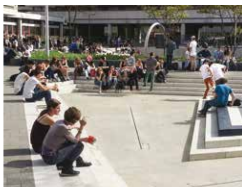
Het Bentheplein in Rotterdam